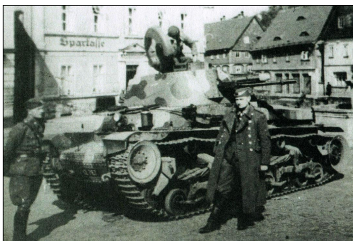
Československý lehký tank Lt-35 před městským úřadem

armády rozebrali všechny dřevěné lávky a podminovali ve Chřibské kamenný most na náměstí. Podminování mostu bylo provedeno tak, že do místní konstrukce bylo vyhloubeno celkem šest dlouhých děr (do kterých bylo položeno 124 kg trhavin), které byly propojeny do společného odpařovacího mechanismu, který byl umístěn před městským úřadem na náměstí.