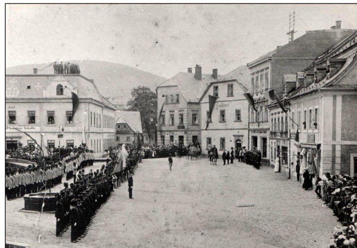
Svobodný pán Friedrich von Beck na chřibském náměstí