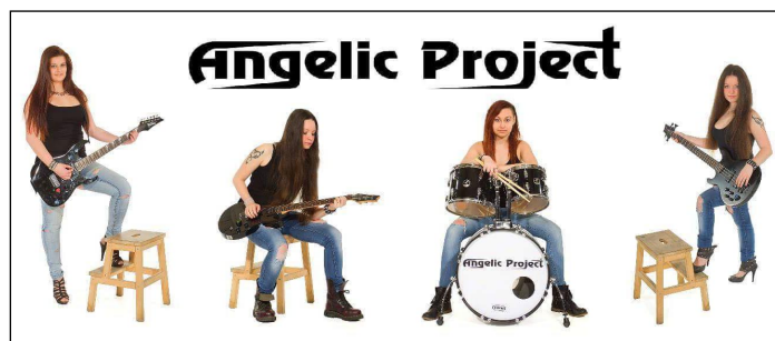
Hudební skupina Angelic Project