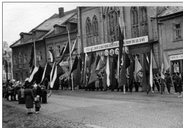
Oslava 1. máje na chřibském náměstí (r. 1960)

Po roce 1945 se náměstí stalo svědkem různých politických událostí. Každoročně se na náměstí slavil 1. máj (pro zajímavost, tribuna stála na čtyřech místech).