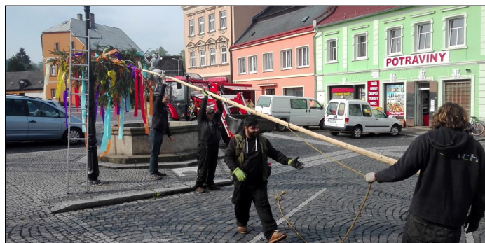
Zaměstnanci města staví májku