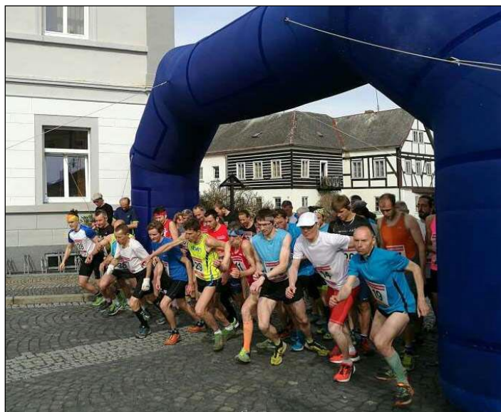
Běžci na startu závodu