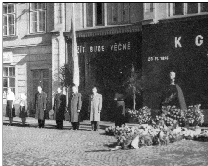
Smuteční tržna k úmrtí Klementa Gottwalda

Na náměstí se také uskutečnily smuteční trzny k úmrtí sovětského vůdce J. V. Stalina (1953) a k úmrtí československých presidentů Klementa Gottwalda (1953) a Antonína Zápotockého (1957).