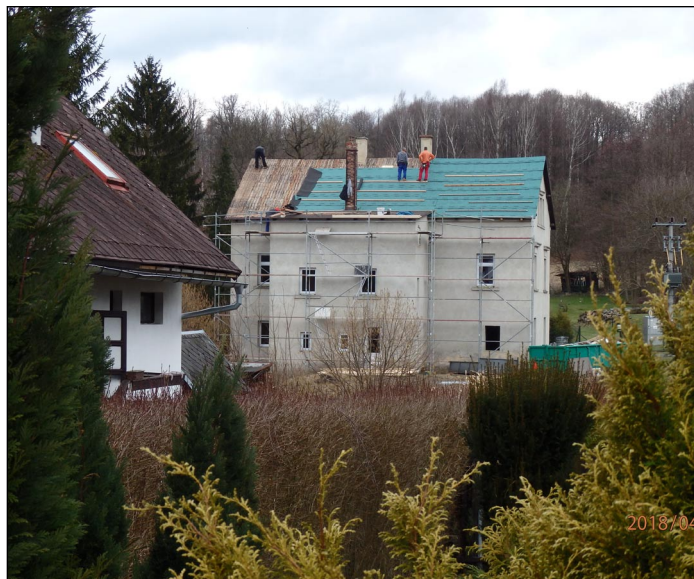
Rekonstrukce bytového domu č. p. 253