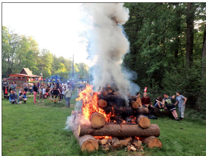
Letošní pálení čarodějnic proběhlo na koupališti