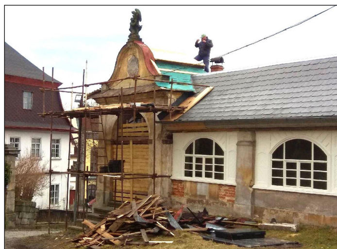
Rekonstrukce ambitu křížové cesty