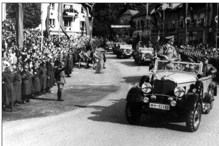
Adolf Hitler projíždí 6. října 1938 Chřibskou

Po Mnichovské dohodě, kdy ČSR musela podstoupit části pohraničí Velkoněmecké říši, pochodovaly 3. října 1938 přes chřibské náměstí jednotky německého Wehrmachtu, a 6. října projížděl Chřibskou, za velkého jásotu místních obyvatel, Adolf Hitler.