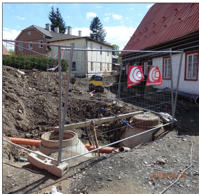
Výstavba kanalizační stoky