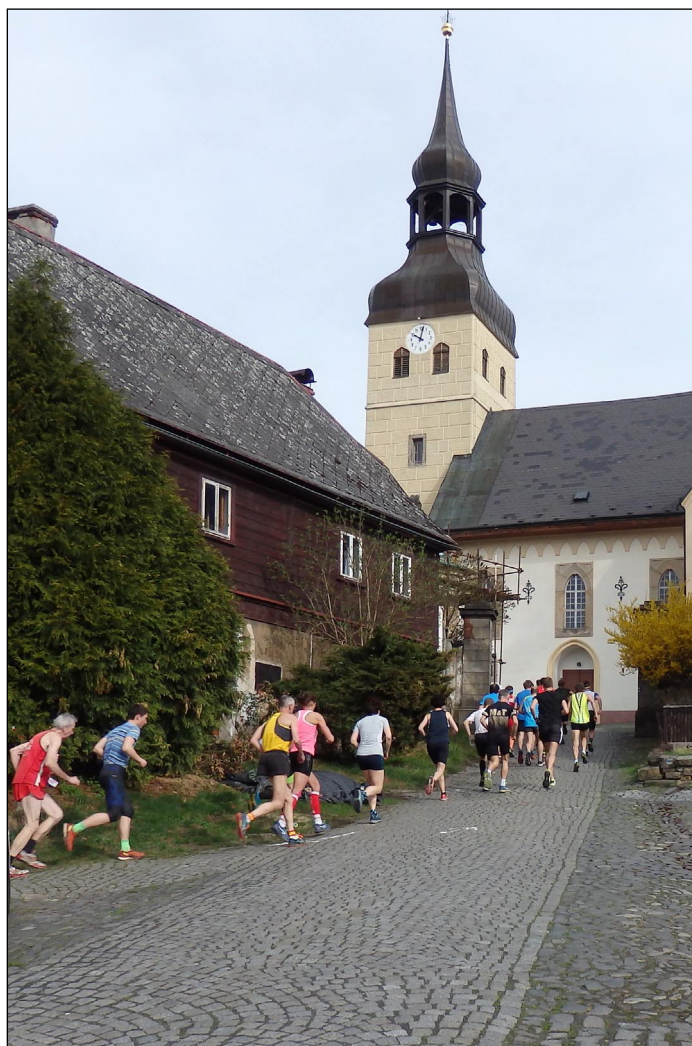
Letos se běželo po nové trase.