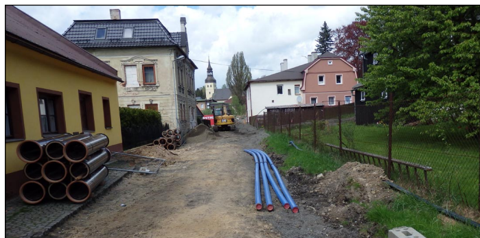
S výstavbou kanalizace se provádí i částečná rekonstrukce vodovodního řádu