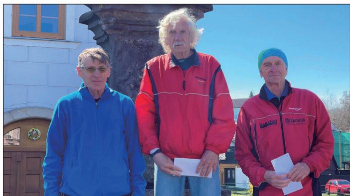
Vítězové v kategorii mužů nad 70 let