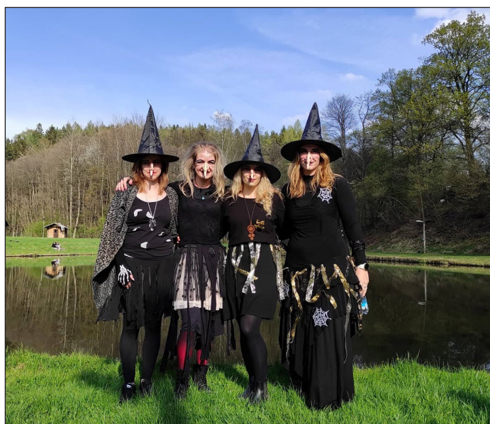
Filipjakubská noc na koupališti