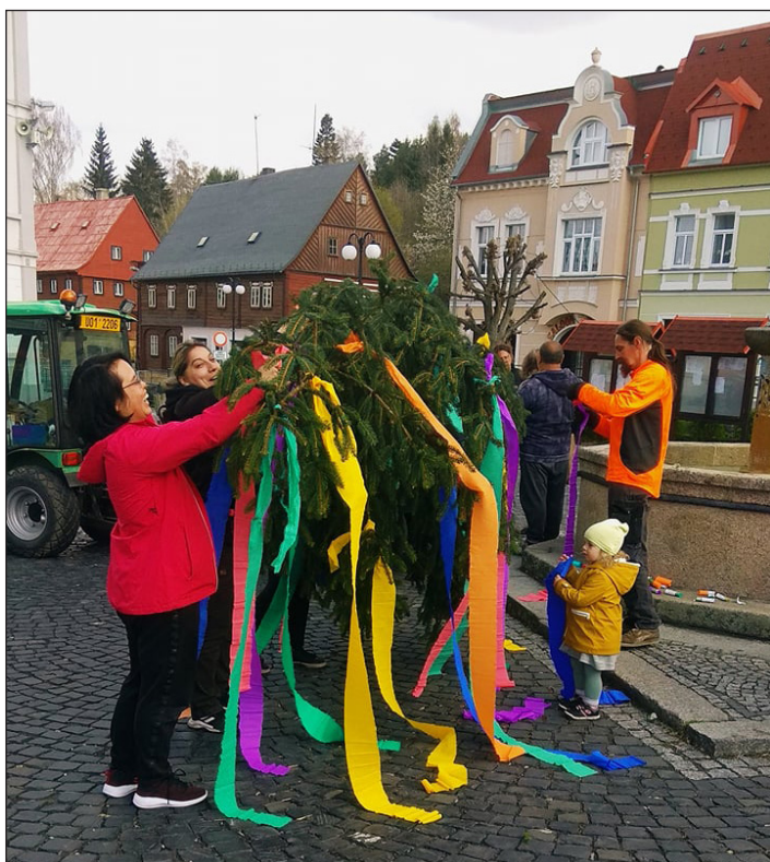
Zdobení májky na náměstí v Chřibské