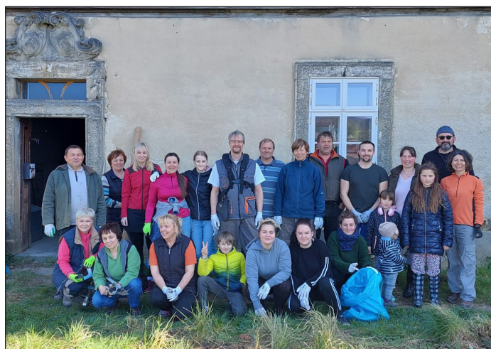
Úžasná parta lidí se sešla 23. dubna za kostelem sv. Jiří a v prostorách bývalé fary v rámci dobrovolné - úklidové akce. V úklidu se pokračovalo ještě 30. dubna, kdy se sešli i další dobrovolníci. Děkuje