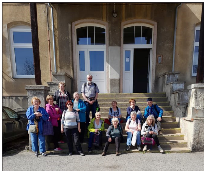
Účastníci výletu do Zvířetic